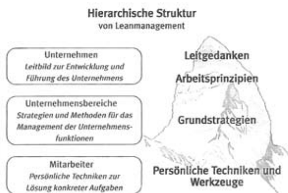
Abb. 1. Hierarchische Struktur von Lean Management (Bösenberg, Metzgen 1995: 39)

Wie die Autoren richtig bemerken, setzt Proaktivität